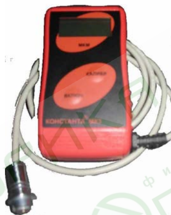
Рисунок 1 Толщиномер индукционный Константа МК3

Внешний вид прибора приведен на рисунке 1.