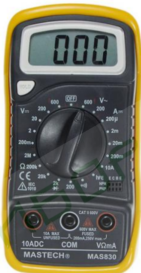
Цифровой мультиметр Mastech MAS830