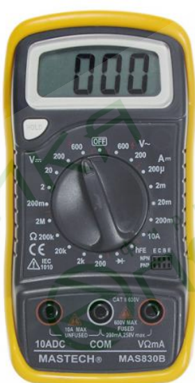
Цифровой мультиметр Mastech MAS830B