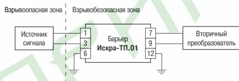
Рис. 2. Схема подключения барьера Искра-ТП.01

Барьер Искра-ТП.01 имеет сопротивление каждой цепи около 110 Ом. В случае использования терморпары, барьер рекомендуется включать в разрыв компенсационных проводов.